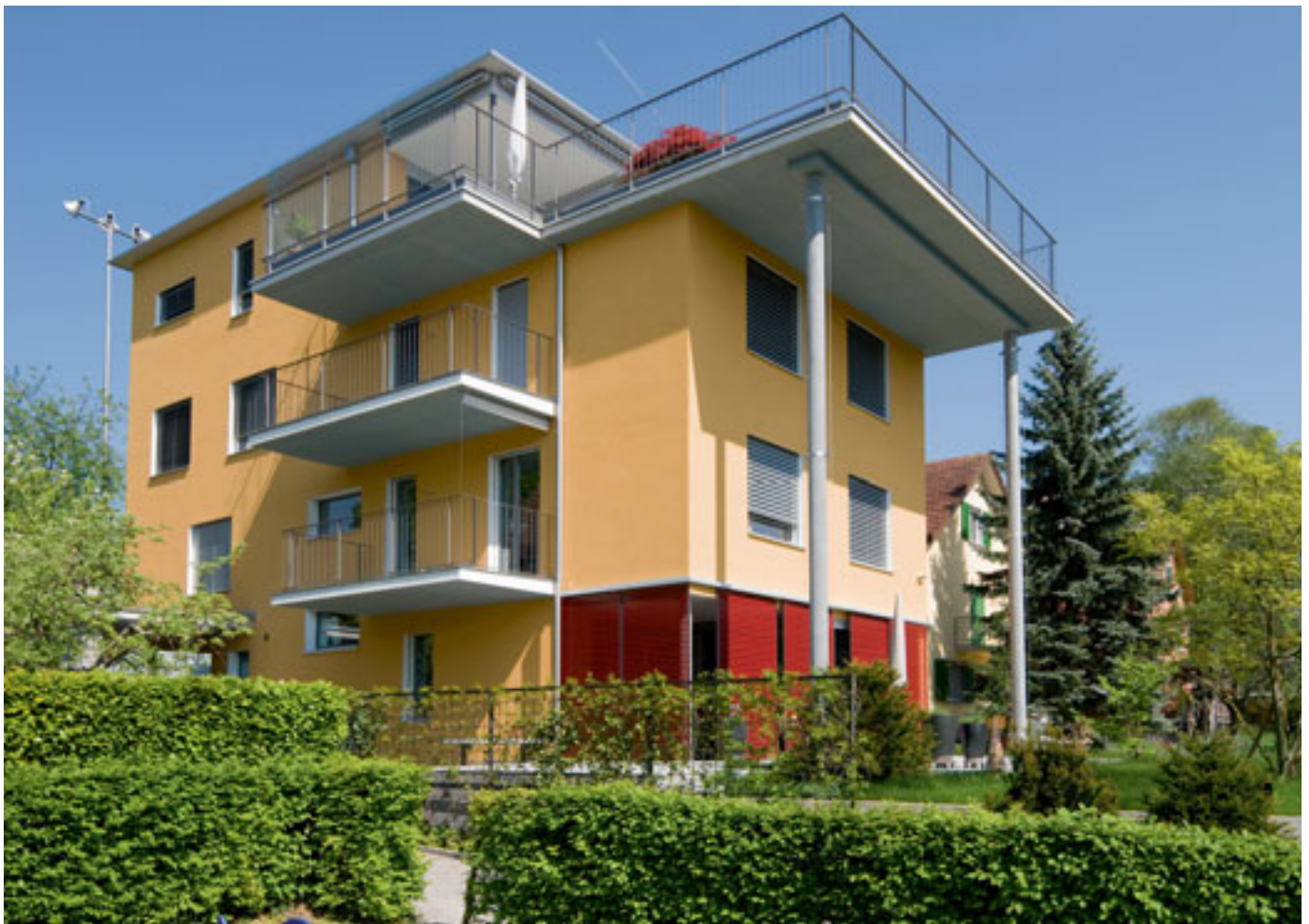
Eine biozidfreie, verputzte Aussenwärmedämmung bedeutet nachhaltige Fassadengestaltung – ob bei einer Sanierung oder bei diesem Neubau mit 200 mm EPS-Dämmung.

Im Zuge der Rationalisierung am Bau wurden Putze seit gut fünfzig Jah-